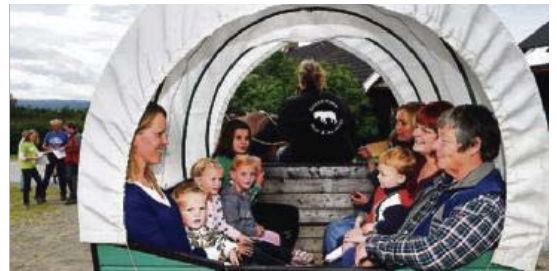
PÅ TUR: Til helgen arrangeres det tur med hest og vogn eller på hest langs setervegene i Rendalen. ILLUSTRASJONSFOTO

Etter å ha passert det høyeste punktet vil følget bevege seg ned mot Sølendalen til den første setervollen, Skjellåvollen og videre til Møyåvollen. Søndagen reiser følget tilbake over fjellet med hest og vogn, og deltakerne vil bli tatt med inn i veidemannens og fangstmannens rike.