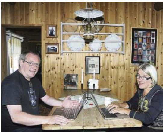
SKRIVEBULE: Forfatterparet har sin skrivebule på setra Nystuvollen på Sjøttåhaugen i Dalsbygda.

- Det er når førsteutkastet er antatt at den egentlig jobben begynner. Dette har vært et langt svangerskap som har vart i tre år, smiler forfatterparet.