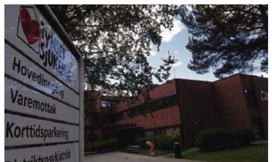
KAMP FOR SJUKEHUSET: Mange kjemper hardt for at sjukehuset på Tynset skal beholde akuttfunksjonen. Nå skal det lages musikkvideo.

I kveld skal det spilles inn en musikkvideo for Tynset sjukehus, der folk oppfordres til å møte opp på rådhusplassen.